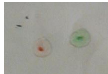
Dessin de cellules p 4