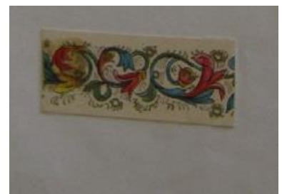
Enluminure en bas de la dernière page