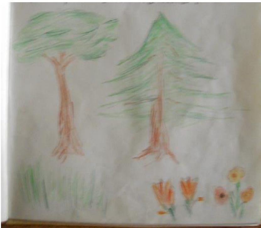
Dessin de la végétation p 5