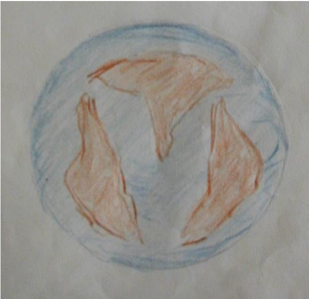
Dessin de la Terre p 3