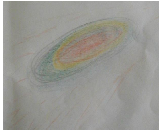
Dessin de la Création p 2