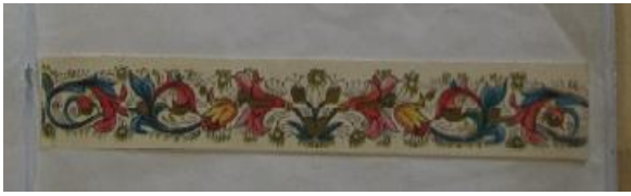
Enluminure en bas de la p 1